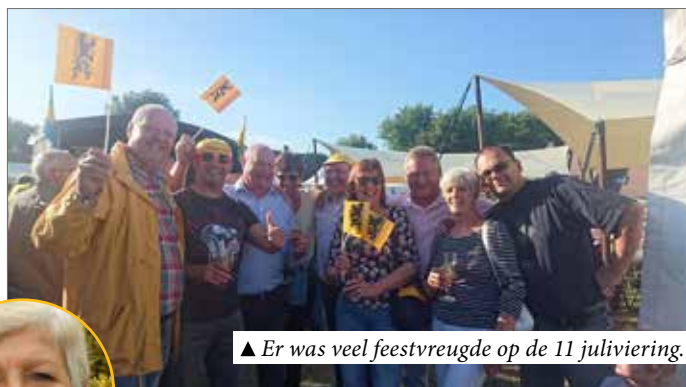
▲ Er was veel feestvreugde op de 11 juliviering.