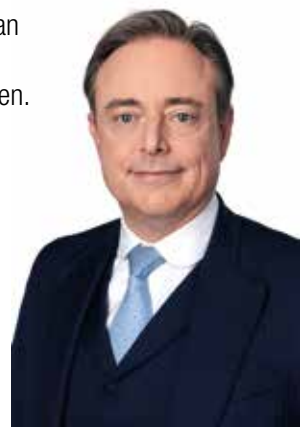
Bart De Wever Algemeen voorzitter