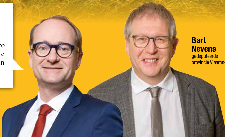
Bart Nevens gedeputeerde provincie Vlaams-Brabant

Vlaams minister van Onderwijs, Sport, Dierenwelzijn en Vlaamse Rand