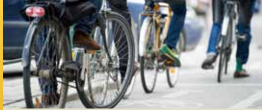
Tijd voor een nieuw mobiliteitsplan (p. 2)