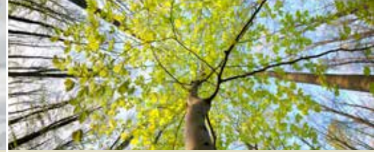
Machelen-Diegem krijgt er vijf hectare bos bij (p. 3)