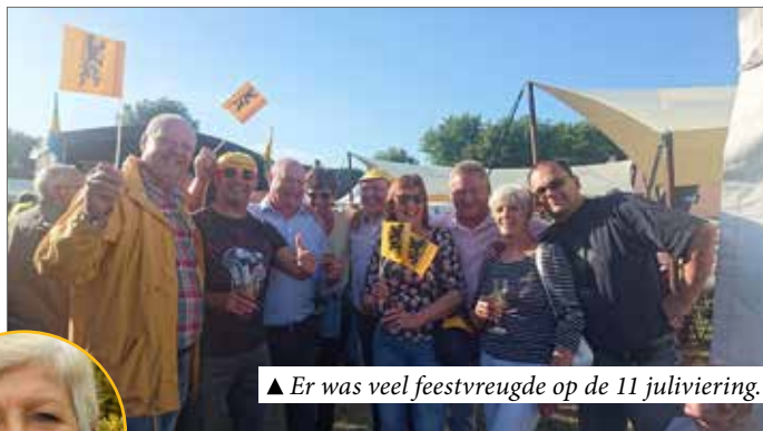
▲ Er was veel feestvreugde op de 11 juliviering.