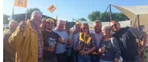
Geslaagde Vlaamse feestdag p. 3