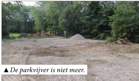
▲ De parkvijver is niet meer.

Sinds kort zien we dat er veel bomen in de gemeente geroid worden om plaats te maken voor nieuwe sportvelden. Machelen beschikt nu over prachtige (iets te bombastische) sportterreinen en sporten is gezond. Maar helaas moest daarvoor een heel groot deel van de bomen en het groen in het park verdwijnen. En groen is nochtans ook van essentieel belang om ons gezond te houden. Zelfs een nostalgisch vijvertje dat er mits het onderhouden wordt, nog prachtig zou uitzien, moest verdwijnen.