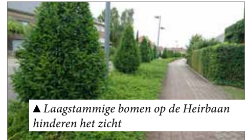
▲ Laagstammige bomen op de Heirbaan hinderen het zicht

De N-VA-fractie vraagt al een hele tijd dat er aan de jeugdterreinen in Diegem en aan de groene beplanting op de Heirbaan dringend iets gedaan wordt. Hier zouden voor de veiligheid laagstammige bomen en struiken gekapt mogen worden: bomen rondom de jeugdterreinen die haast omvallen en beplantingen die het zicht van de in- en uitritten van de woningen op de Heirbaan beperken. We moeten het groen behouden, maar de veiligheid achterwege laten is een brug te ver.