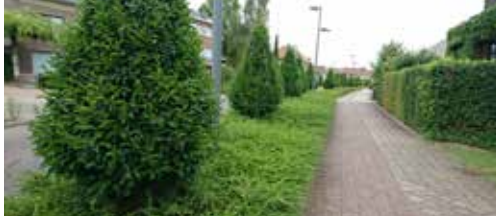
N-VA pleit voor doordacht groenbeleid p. 2